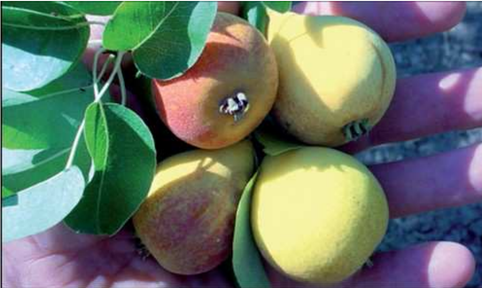
Pera S. Anna

La pera Sant'Anna (in foto) è un frutto medio-piccolo, dal delizioso sapore zuccherino, di colore giallo che presenta piccole macchie rosse nelle parti più esposte al sole. Si coltiva nella zona del Sannio. È una varietà abbastanza antica, che matura a fine luglio, intorno al 26, giorno di Sant'Anna, da cui prende il nome. Nelle stessa zona si coltiva anche la pera Spina, simile in tutto e per tutto alla Sant'Anna tranne che nelle dimensioni, poiché i suoi frutti sono leggermente più piccoli. Anche la pera Spina è un frutto tipicamente estivo, poiché matura intorno alla fine di luglio.