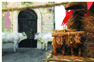
3° Posto Colore - Paolantonio Nicola "I buoi, la paglia...la paglia, i buoi"