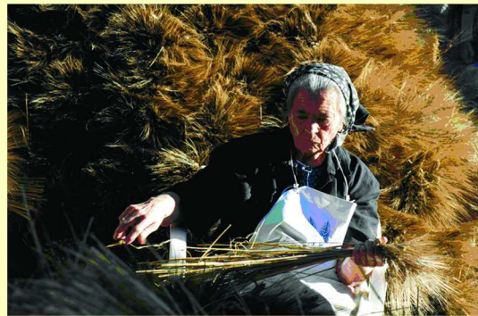
Migliore Autore - Paolantonio Nicola "Riflessi dorati"