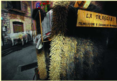
2° Posto Colore - De Rensis Roberto "La Traglia"