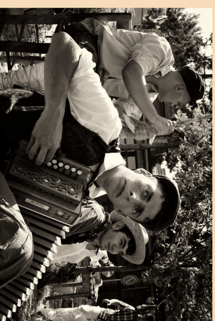
Trofeo La Tradizione della Sfilata PIANO Gianna "Festa del grano n. 6"