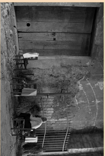
2° posto B/N - COLELLA Domenico "Lavorando"