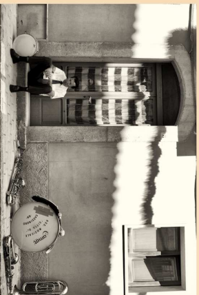
3° posto B/N - PIANO Gianna "Festa del grano n. 7"