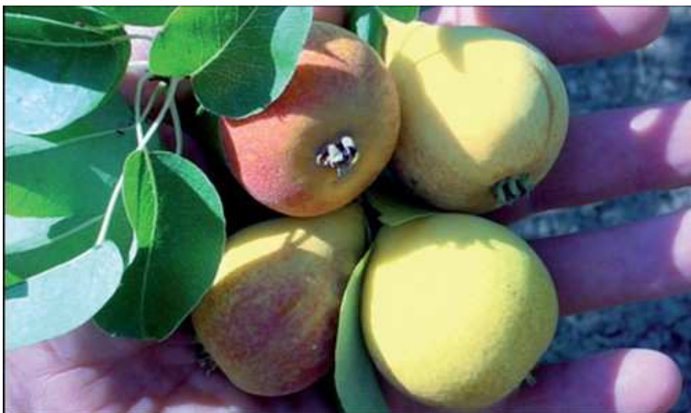
Pera S. Anna

La pera Sant'Anna (in foto) è un frutto medio-piccolo, dal delizioso sapore zuccherino, di colore giallo che presenta piccole macchie rosse nelle parti più esposte al sole. Si coltiva nella zona del Sannio. È una varietà abbastanza antica, che matura a fine luglio, intorno al 26, giorno di Sant'Anna, da cui prende il nome. Nelle stessa zona si coltiva anche la pera Spina, simile in tutto e per tutto alla Sant'Anna tranne che nelle dimensioni, poiché i suoi frutti sono leggermente più piccoli. Anche la pera Spina è un frutto tipicamente estivo, poiché matura intorno alla fine di luglio.