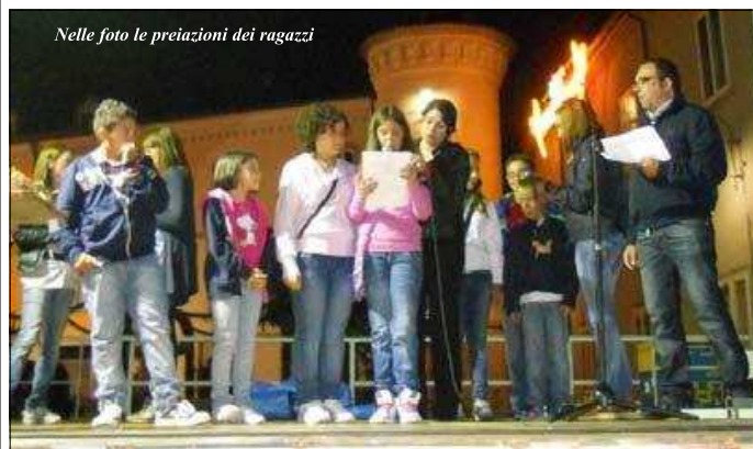
Nelle foto le premiazioni dei ragazzi

Alle 20.30, si entrerà nel pieno della manifestazione patrocinata dall'Assessorato al Turismo regionale, dal Comune di Jelsi e l'Associazione "Gli Orsi Volanti" con la direzione del regista Pierluigi Giorgio. Dinanzi al Palazzo Valiante, ospiti d'onore Kay Mc Carthy in concerto, per offrirvi un viaggio tra le melodie di una voce incantevole e le corde di un'arpa, fra tradizione orale e misticismo, tra natura e protesta: un viaggio nella terra d'Irlanda! A seguire, la straordinaria narratrice irlandese Georidin Breathnach che riterrà il Premio per conto del "Festival Internazionale delle Tradizioni Gaeliche" con sede a Dublino.