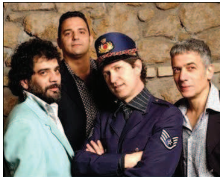
Il Parto delle NuvolePesanti

Il gruppo è formato da musicisti di estrazione prevalentemente moderna provenienti, quindi, da esperienze jazz, funky, latin ed etniche; esegue un repertorio in-