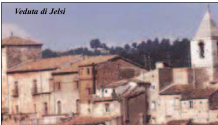
Veduta di Jelsi

VIA SAN GIOVANNI IN GOLFO - TEL. 0874/484623 - FAX 0874/484625