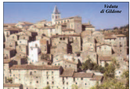
Veduta di Gildone

E' stato mai innamorato? Queste e altre le domande che hanno manifestato la curiosità e la vitalità dei ra-