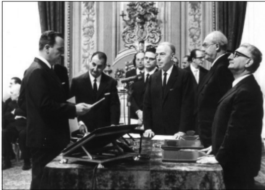
Foto del 1968 durante la cerimonia di giuramento di Giacomo Sedati, Ministro dell'Agricoltura, davanti al Presidente Leone

Si tratta di un momento di riflessione - prosegue il sindaco - non solo per la nostra comunità, ma anche per l'intera re-