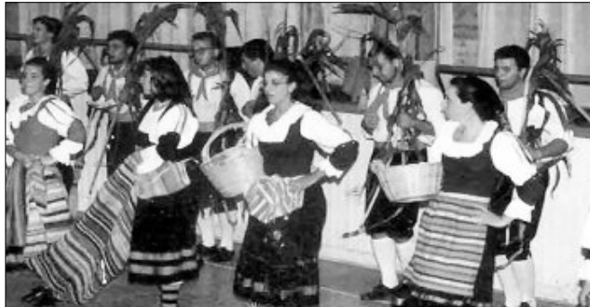
Protagonisti delle serate gruppi del Perù dell'Africa e dell'Abruzzo

Venerdì protagonisti indiscussi della serata internazionale i gruppi del Perù, dell'Africa ed il gruppo abruzzese del Gran Sasso. La serata si aprirà con l'intervento delle autorità e l'apertura solenne del festival. Sabato 1° agosto la manifestazione proseguirà con l'esibizione del gruppo folk di Cuneo "Abnoba" mentre il giorno successivo si esibiranno i gruppi del